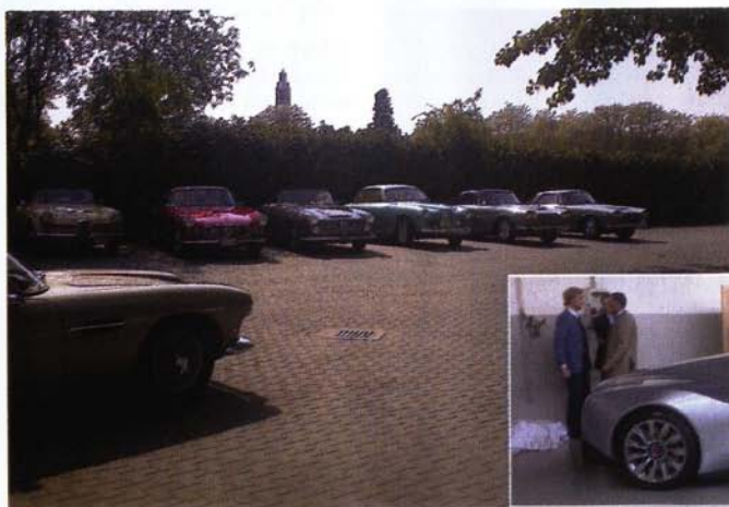
Le Touring schierate nel piazzale.

La Storia e il Futuro del glorioso marchio si sono di nuovo incontrati a Terrazzano di Rho, presso l'atelier della Carrozzeria Touring Superleggera Srl, dove ai soci del Registro è stata riservata la prima presentazione in Italia della nuovissima supercar Gumpert Tornante.