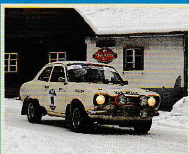
THE WINTER TRIAL