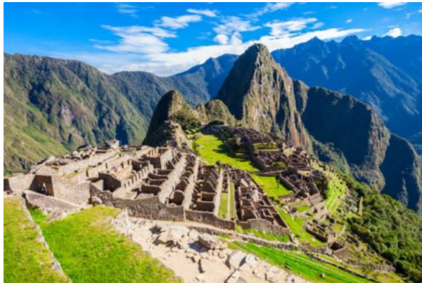
Un'immagine del Machu Picchu

L'emozione più grande, è vissuta a Machu Picchu , sito archeologico Inca, situato sulla Cordigliera centrale delle Ande, a 2430 metri, una delle sette meraviglie del mondo. La città perduta degli Inca è l'unico sito non saccheggiato dagli spagnoli, proprio perché ben nascosto e protetto , accessibile all'epoca all'imperatore e alla nobiltà Inca.